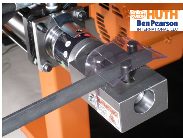
Doblador de soportes de varilla n.º de parte 985

Compatible con todos los modelos de dobladoras y expansores Huth modelos 1690, 1691, 1673 y 1674.