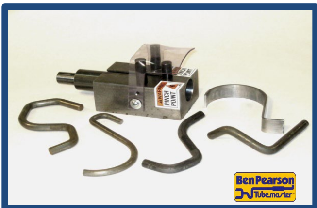
Dobladora de soportes de varilla Ben Pearson, n.º de pieza 75985

Compatible con los modelos MB97, BP79, BP08, BP11, 3012.